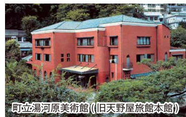
町立湯河原美術館(旧天野屋旅館本館)

芸者さんの案内で、万葉公園から町立湯河原美術館までの老舗旅館内を特別に見学させていただきます。各旅館では、館主や女将から旅館の歴史などについて説明していただき、美術館では学芸員に案内していただきます。終了後、希望者には上野屋旅館の無料入浴券(当日のみ有効)を差し上げます。